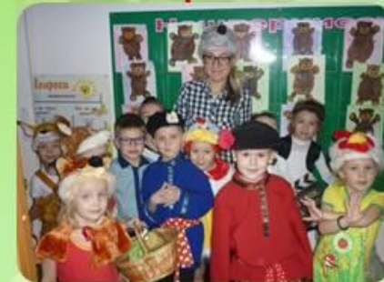
Восприятие худ. литературы, фольклора